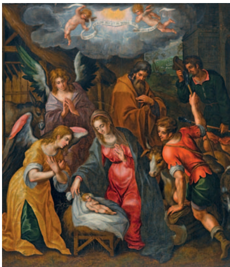
Hendrik de Clerck (1560/1570–1630): Geburt Christi