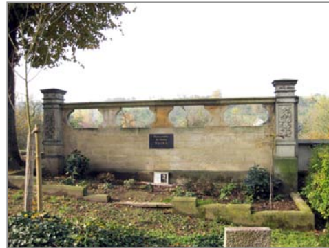
Grabstätte der Familie Nacke, 2009

ckes auf dem Friedhof in Constappel angenommen und investiert viel Zeit und Geld in eine würdige Grabstelle für Sachsens Automobilpionier. Dort fehlt nur noch die schmiedeeiserne Grabeinfassung, die seit ca. 1960 verschwunden ist. Für eine Wiederherstellung werden dringend Sponsoren gesucht.