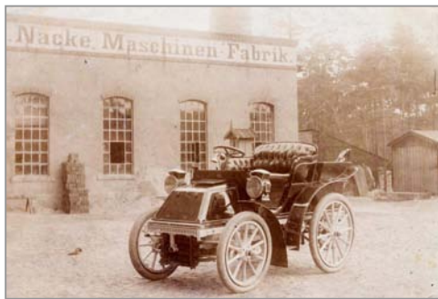
Einer der ersten Coswiga-Wagen