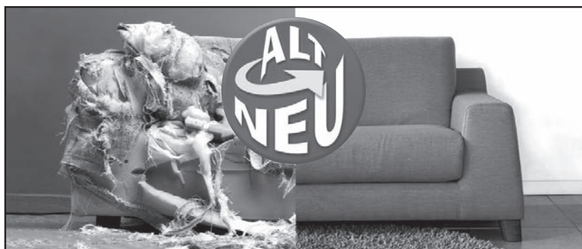
Ab sofort erhalten alle Kunden beim Kauf neuer Polstermöbel bei Hülsbusch bis zu 30 Prozent Tauschrabatt für die alten Möbel.

Wer jetzt die besten Schnäppchen machen möchte, sollte sich allerdings beeilen, denn die Polster Tausch-Aktion bei Möbel Hülsbusch wird einmalig verlängert bis 14.11.2015. Möbel Hülsbusch, Ehrlichtweg 3-9 in Weinböhla, Telefon: 035243-3380, E-Mail: info@huelsbusch.com, hat montags - freitags von 10-19 Uhr und samstags von 9 -16 Uhr für seine Kunden geöffnet.